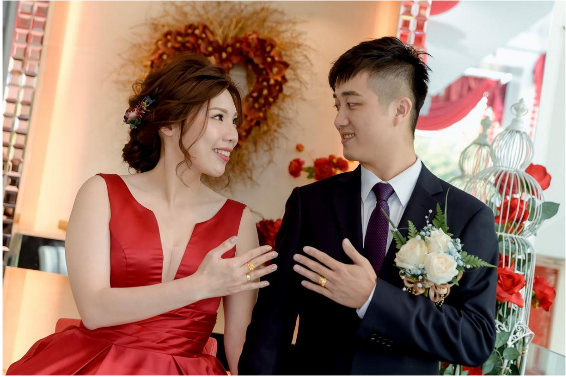
準婆婆替新娘戴上耳環、項鍊、手鍊，作為見面禮之意。